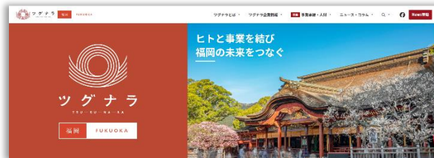
「ツグナラ福岡」トップ画面 ( https://tgnr.jp/fukuoka/ )

ツグナラは「次世代により良い社会を引き継ぐ」をメインコンセプトに「地域未来を担う企業」として「地域の経営資源引き継ぎ」を全面的に打ち出し、M&A のみではなく親族内の事業承継、働く社員、ステークホルダー、外部への承継など、ありとあらゆる経営資源の引き継ぎを促進していく事業承継支援サービスです。地域内同士での地域経営資源の引き継ぎを希望する企業に対して、地域未来を担う企業と迅速にマッチングすることで結果として地域経済が活性化することを目標に運営をしております。