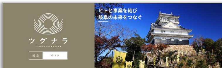
「ツグナラ岐阜」トップ画面 ( https://tgnr.jp/gifu/ )