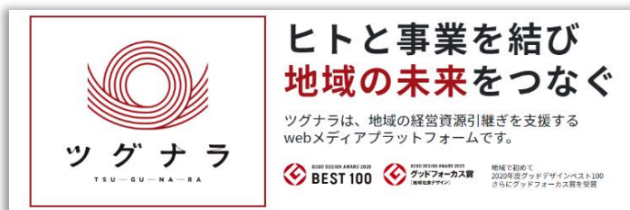
「ツグナラ全国版」トップ画面 ( https://tgnr.jp/ )

ツグナラは「次世代により良い社会を引き継ぐ」をメインコンセプトに「地域未来を担う企業」として「地域の経営資源引き継ぎ」を全面的に打ち出し、M&A のみではなく親族内の事業承継、働く社員、ステークホルダー、外部への承継など、ありとあらゆる経営資源の引き継ぎを促進していく事業承継支援サービスです。地域内同士での地域経営資源の引き継ぎを希望する企業に対して、地域未来を担う企業と迅速にマッチングすることで結果として地域経済が活性化することを目標に運営をしております。