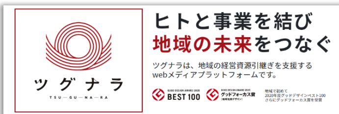
「ツグナラ全国版」トップ画面 ( https://tqnr.jp/ )