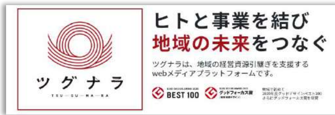
「ツグナラ全国版」トップ画面 ( https://tgnr.jp/ )