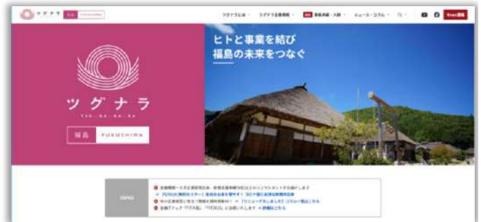
「ツグナラ福島」トップ画面 ( https://tgnr.jp/fukushima )